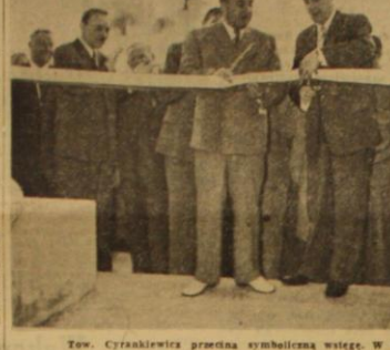
Tow. Cyrankiewicz przed symbolicznym wstęgiem...